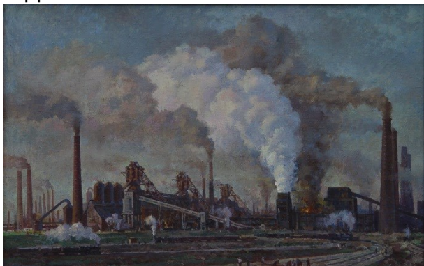
Рис. 1. Бернгард. Нижнетагильский металлургический завод

Завершая рассказ о создании Нижнетагильского музея изобразительных искусств, отметим, что его коллекция с 73 произведений выросла до 10 тысяч произведений. В ее состав входят произведения русских и советских художников, а также западно-европейских живописцев. Но мы бережно храним то, что в свое время было основой коллекции нашего музея – произведения, рассказывающие о подвиге советского народа в годы Великой отечественной войны.