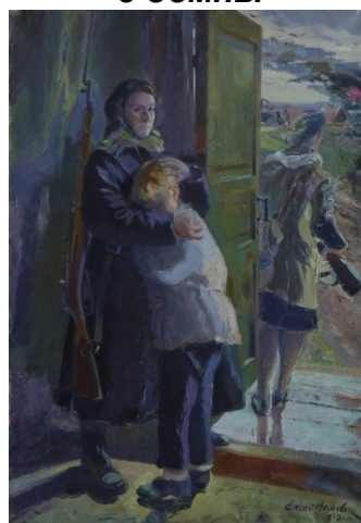
Рис. 4. Немов. Враг близко