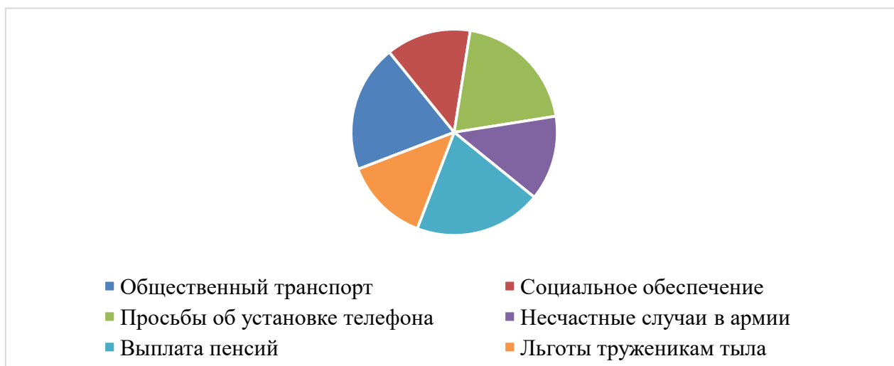
Рис. 1. Причины обращения жителей Нижнего Тагила в городской Совет ветеранов в 1997–1999 гг.