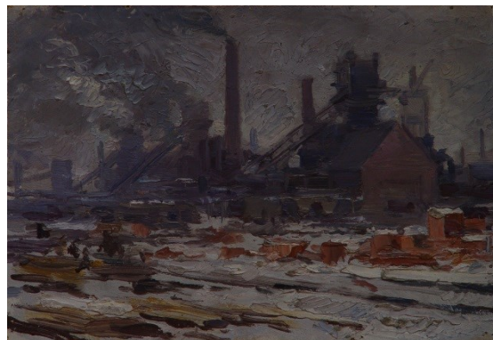
Рис. 2. Бернгард. Строительство 3 домны