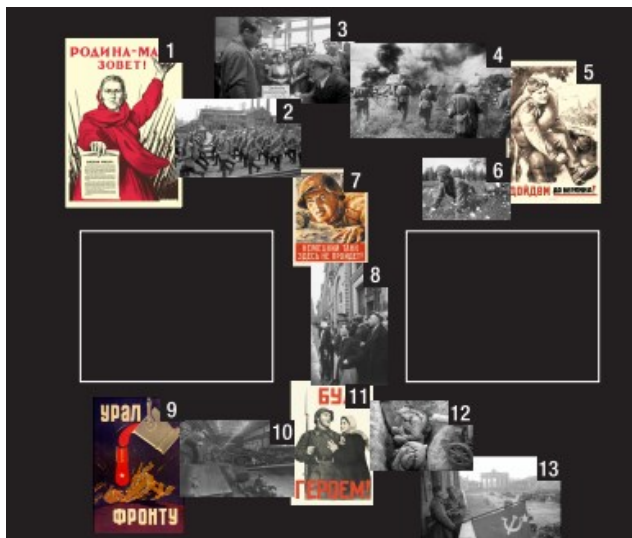
Рис. 2. Схема изображений главы «Великая Отечественная война»

зять другую, менее известную фотографию Е. А. Халдея – «Красноармейцы поднимают советский флаг на балконе отеля «Адлон» у Бранденбургских ворот». В мае 1945 года фотографий бойцов со знаменем Победы было сделано несколько, имена бойцов на выбранной для экспозиции фотографии не известны широкой публике, но от этого их вклад в победу не становится меньше.