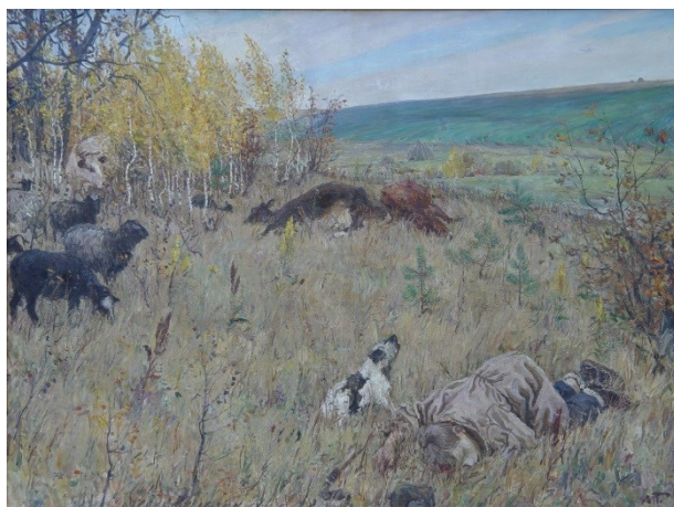
Рис. 5. Пластов. Фашист пролетел