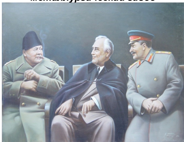
Рис. 3. Бирюков. Ялтинская конференция